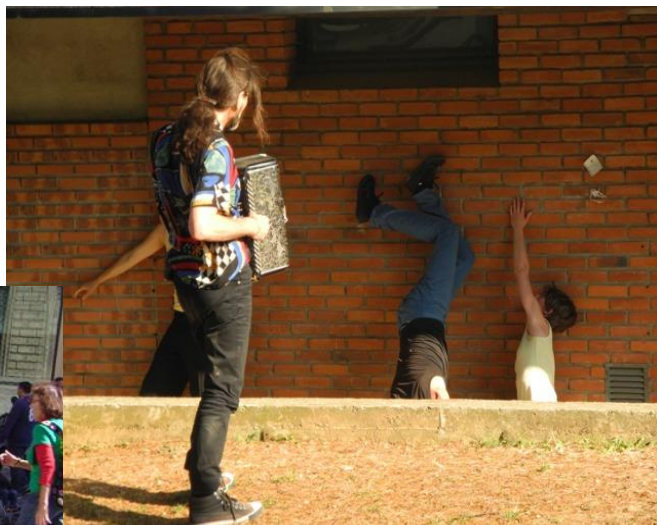
Partage de musiques et de danses