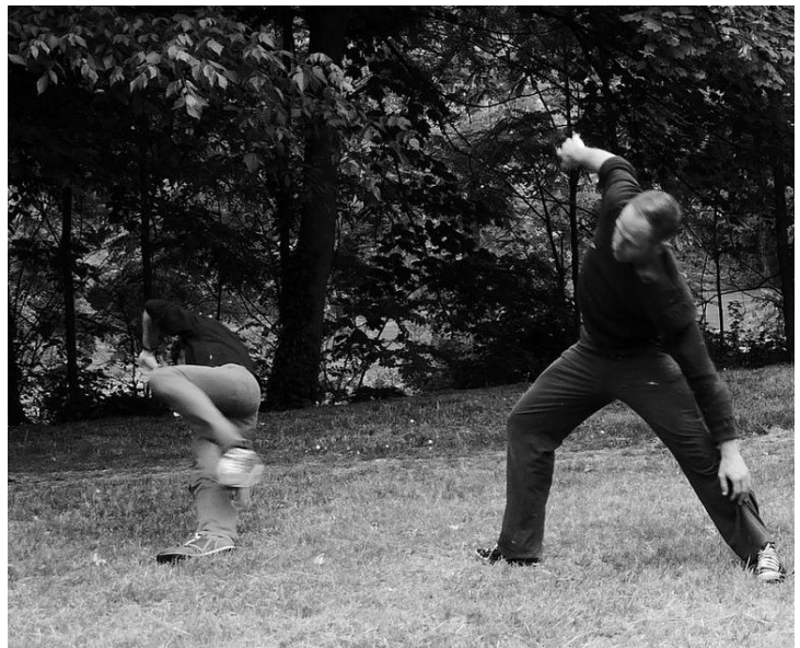
Danse et Environnement